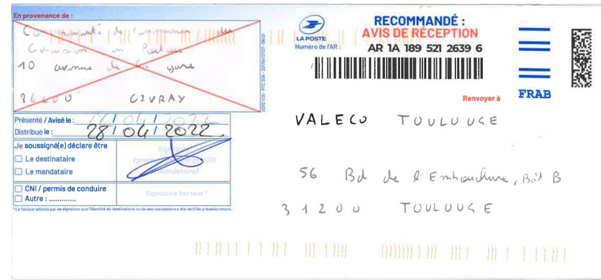
Illustration 6 : Avis de réception